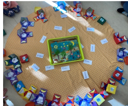
Die Schöpfungsgeschichte: Ein gemeinsames Projekt der 1. und 4. Kl.