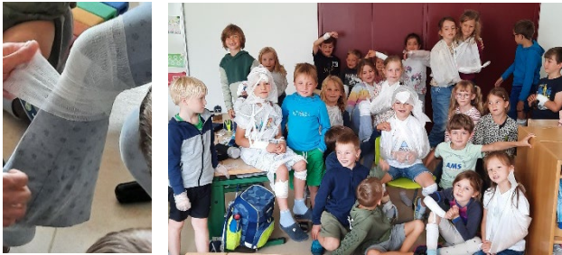
1.-Hilfe-Kurs für Schüler