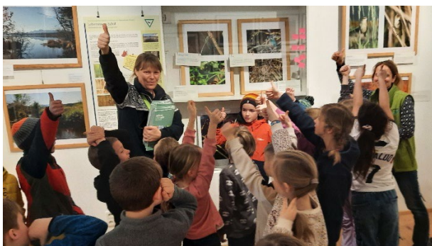
Ausflug ins Museum zur Ausstellung „Fieberklee und Höllenotter“