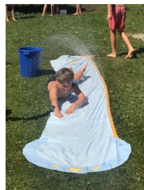
Abkühlung für heiße Tage