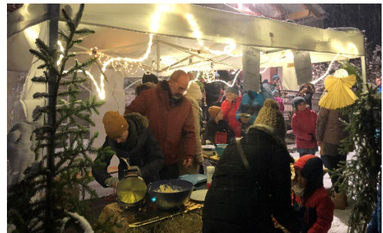
Einstimmung auf die Adventszeit