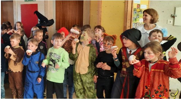
Wild geht's zu im Fasching