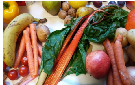
Erntedankfest an der Schule